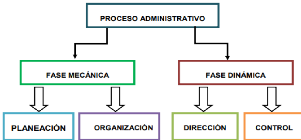
Figura 2: Fases del proceso administrativo.

Los elementos del proceso administrativo, representado en la Figura 2, son un conjunto de fases o pasos a seguir que permiten dar solución a los problemas administrativos. En dicho proceso administrativos existen asuntos organizacionales, de dirección y control, que para ser resueltos debe existir una buena planeación, un estudio previo y tener objetivos claros para una mayor fluidez del proceso (Cruz & Jiménez, 2016).