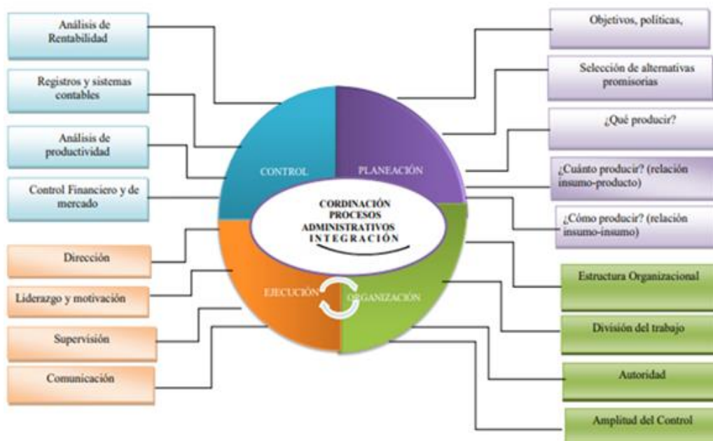
Figura 1: División de las funciones administrativas.

Fuente: Manual de Administración de Empresas Agropecuarias (Guerra, 1992). Ajustado por: Autores.